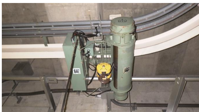
操作した小型クレーン