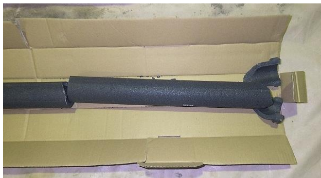
荷解き作業で破損した排気ガスフィルター