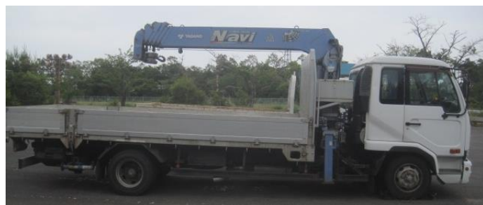
※2 小型移動式クレーン（トラッククレーン）