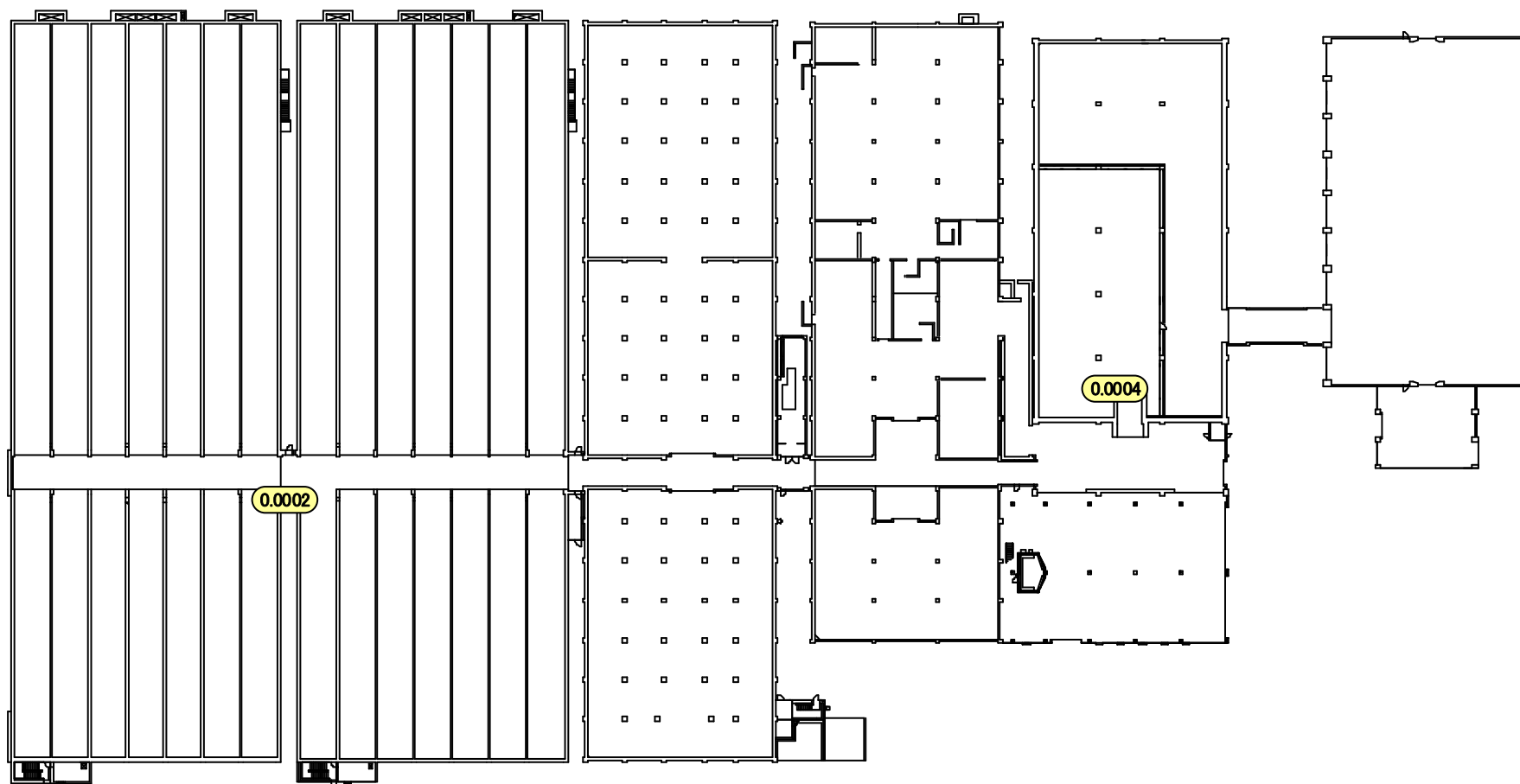
固体廃棄物貯蔵庫 第3棟