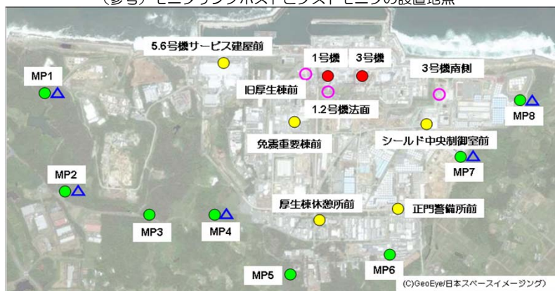
(参考) モニタリングポストとダストモニタの設置地点

※モニタリングポストのリアルタイムデータにつきましては、当社ホームページ「福島第一原子力発電所構内でのモニタリングポスト計測状況」 http://www.tepco.co.jp/nu/fukushima-np/f1/index-j.html からご覧いただけます。