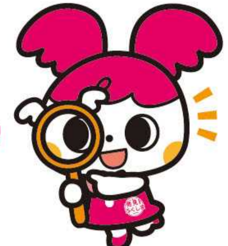
「発見!ふくしま」公式キャラクター 「めっけちゃん」