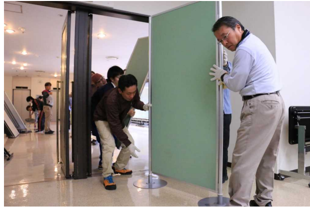
パネル搬入の様子[2016年3月19日撮影]