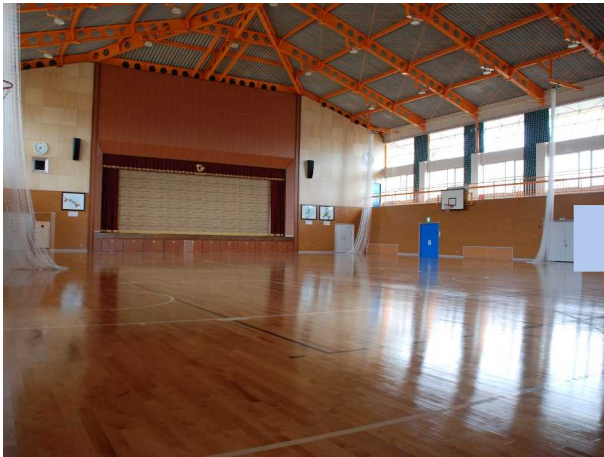
会場設営前の様子[2016年4月8日撮影]

実施内容 富岡町よりご要請をいただき「富岡町復興への集い2016」の開催に向けた会場設営（会場へのマット敷きやテーブルの配列等）を富岡町職員と協働で実施。