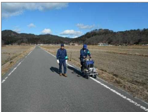
モニタリング状況

小学生の参加も見込まれることから、地表から1mの高さでの計測に加え、50cmの高さでの計測も実施。