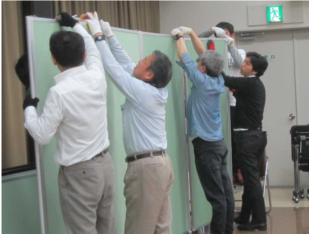
パネル組み立ての様子[2016年3月19日撮影]

実施内容 双葉郡未来会議事務局さまよりご要請いただき、会議開催に向けた会場設営（パネルの運搬・組み立て）ならびに事務局側スタッフ（ブースへの展示・対応等）として運営補助を実施。