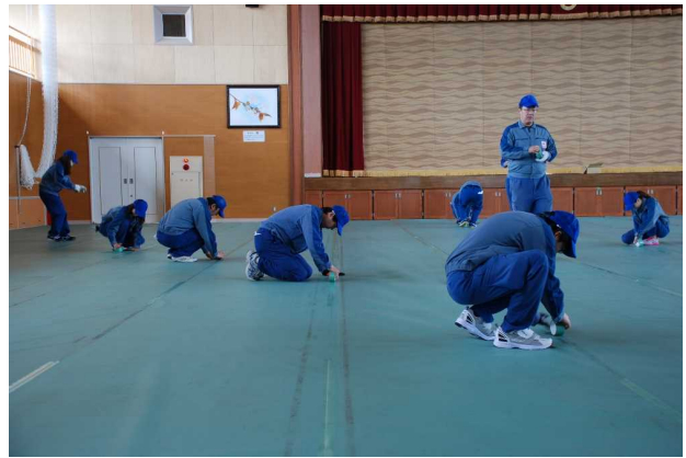
マット固定の様子[2016年4月8日撮影]