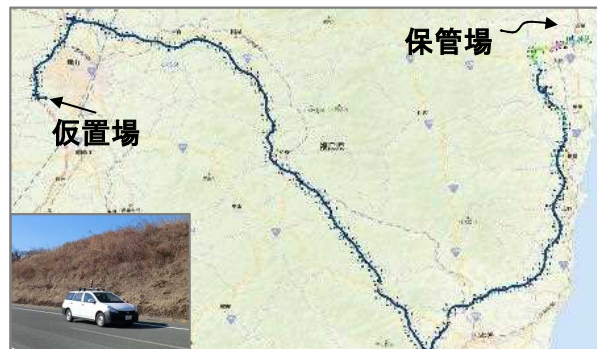
輸送ルートでのモニタリング例