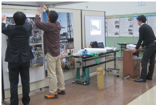
ブースへの展示の様子[2016年3月19日撮影]