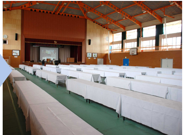
会場設営後の様子[2016年4月8日撮影]