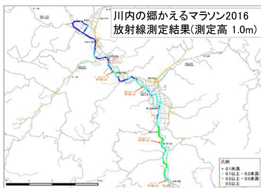
1.0m高さ空間線量率分布図