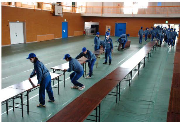
テーブル配列の様子[2016年4月8日撮影]