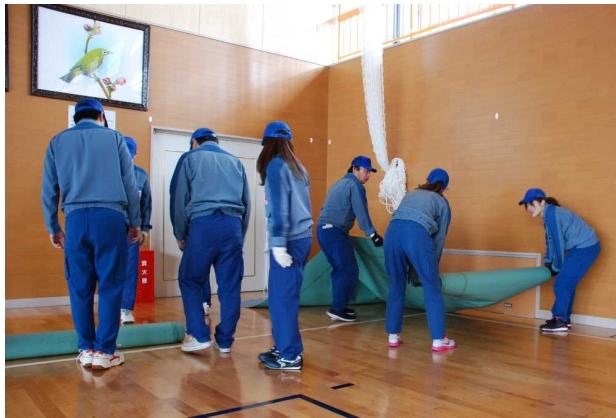
マット敷きの様子[2016年4月8日撮影]