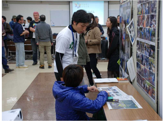
ブース対応（スタッフ）の様子[2016年3月19日撮影]