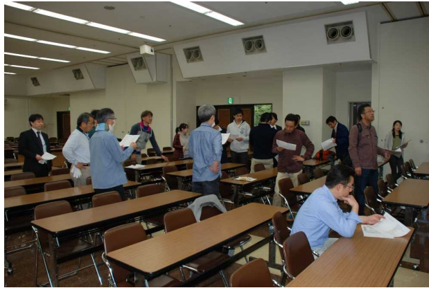
全体ミーティングの様子[2016年3月19日撮影]