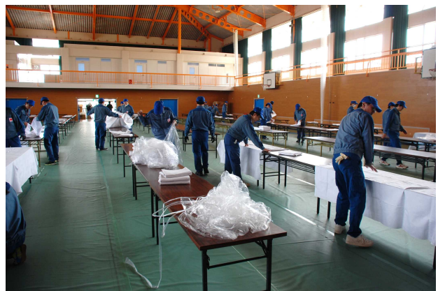
テーブルクロスがけの様子[2016年4月8日撮影]