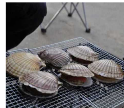
ホタテ焼き（イメージ）