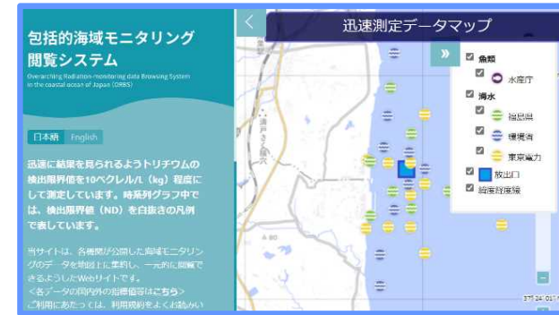
＜海域モニタリング迅速測定結果データマップ＞