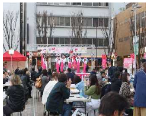
パンダ広場でのイベント（イメージ）