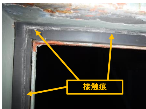
空気流入がなかった箇所の接触痕（扉左上）