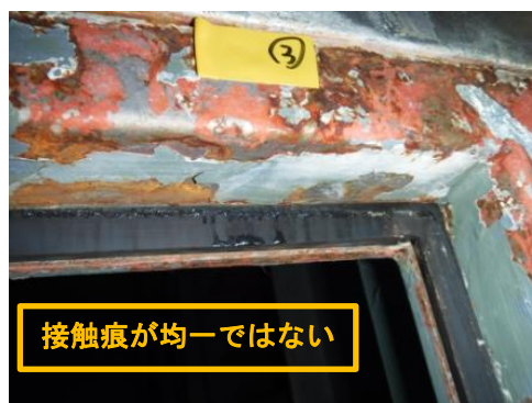
空気流入が確認された箇所の接触痕（扉右上）