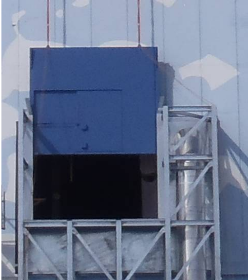
閉止パネル設置中