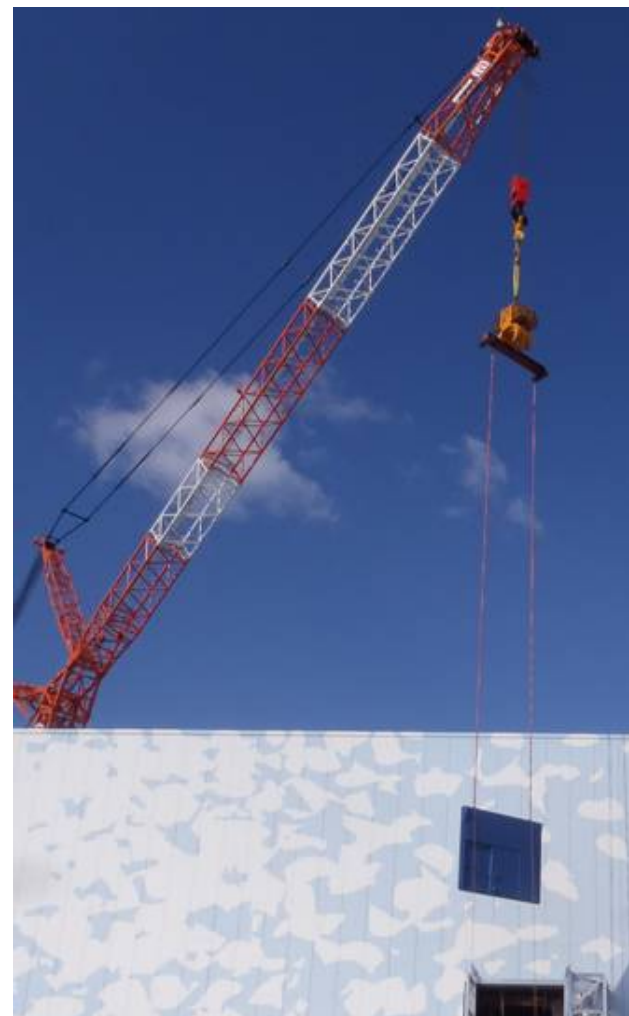
閉止パネル*揚重中

*ブローアウトパネルと記載していましたが、正しくは閉止パネルになります。 お詫びして、訂正させていただきます。