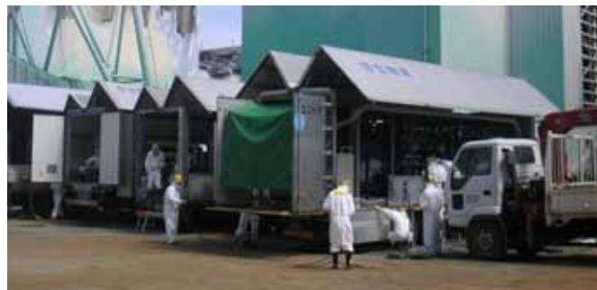
塩分除去 逆浸透膜(RO)装置