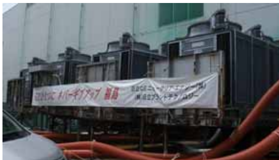
使用済燃料プール 循環冷却装置