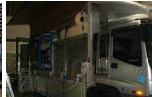
塩分除去 モバイルRO装置