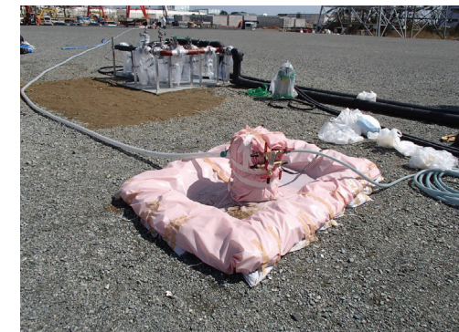
No.3貯水槽のポンプ設置状況(4/13撮影)