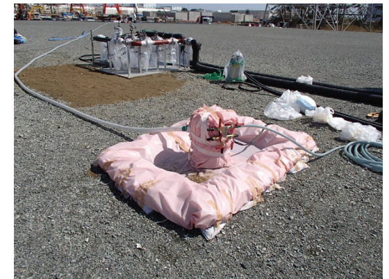
No.3貯水槽のポンプ設置状況(4/13撮影)