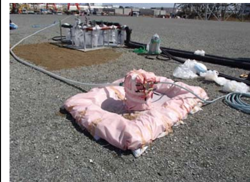
No.3貯水槽のポンプ設置状況(4/13撮影)