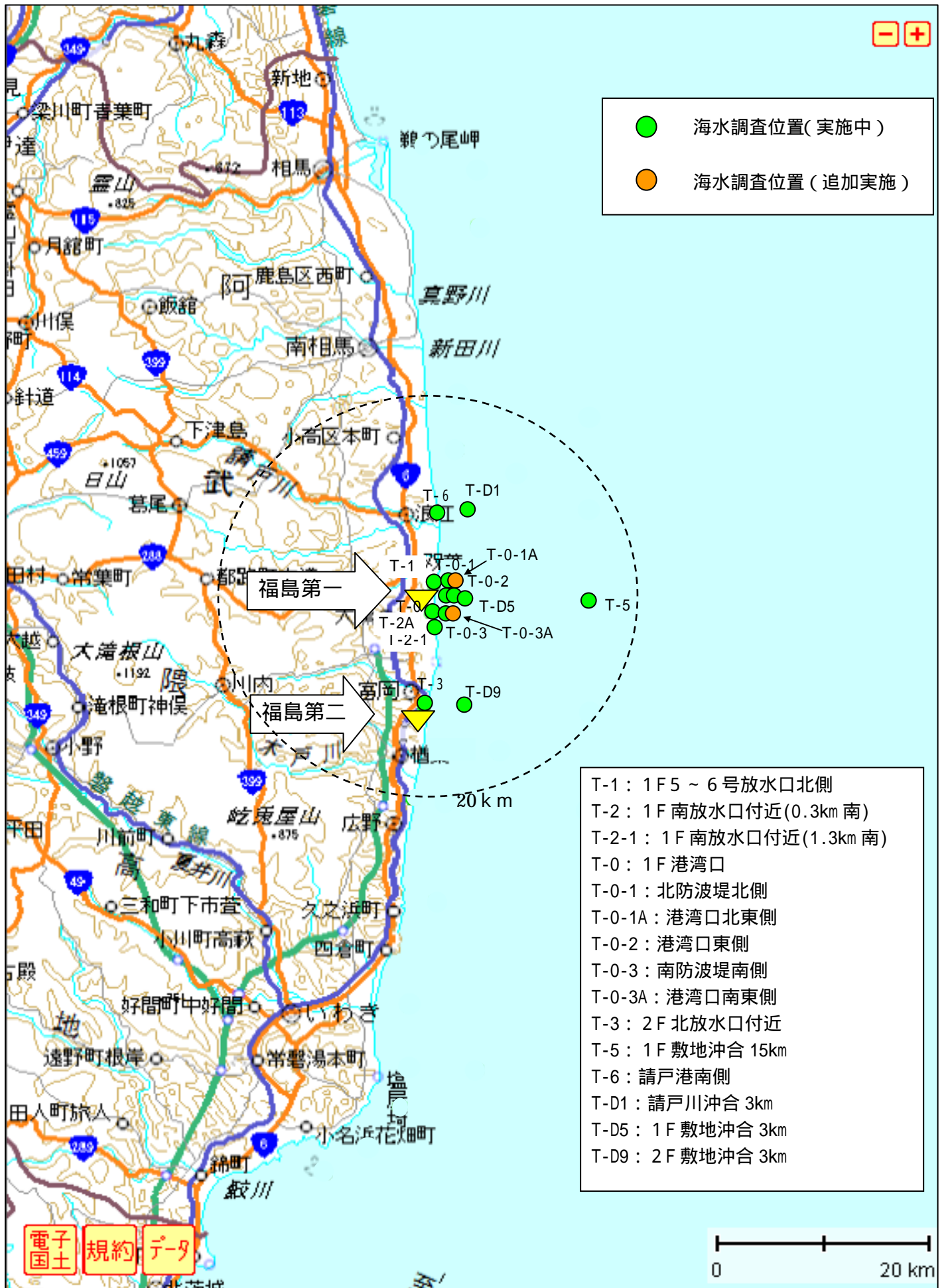
図1. 1F 周辺における海水中の放射性 Cs, 全 \beta , H-3 等の主な調査位置