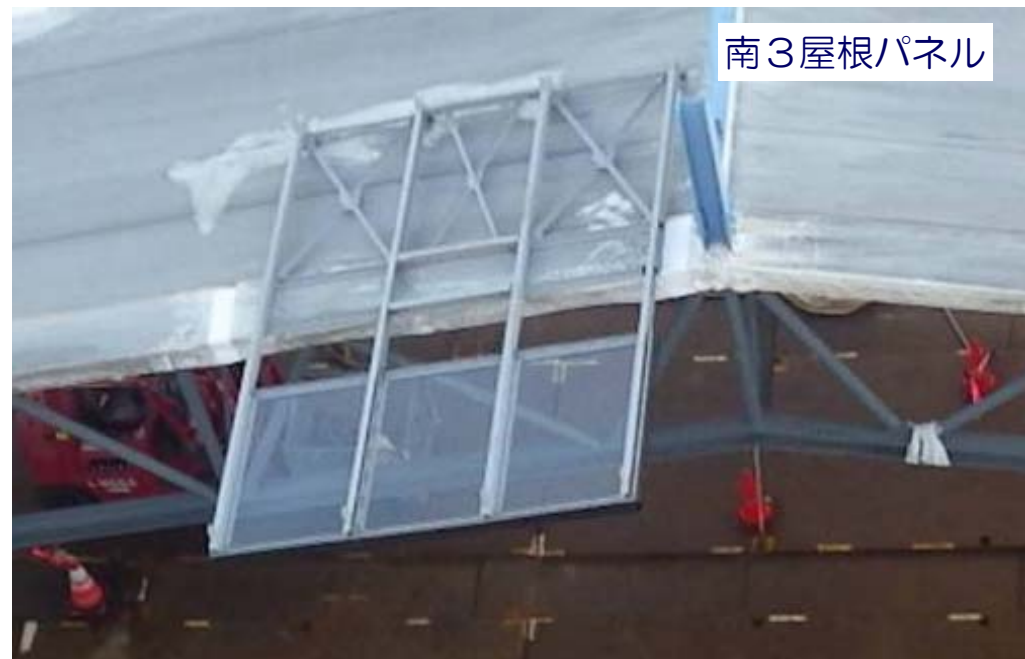
はね出し部材取り付け状況