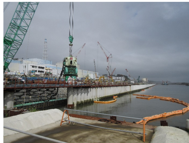
< 鋼管矢板 >