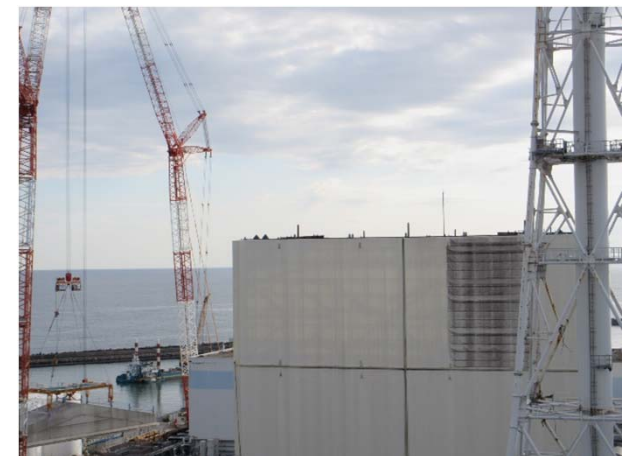
建屋付近から撮影