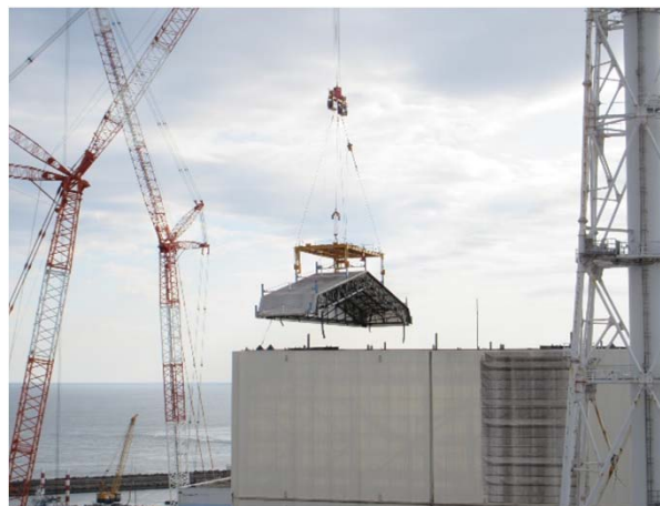
建屋付近から撮影