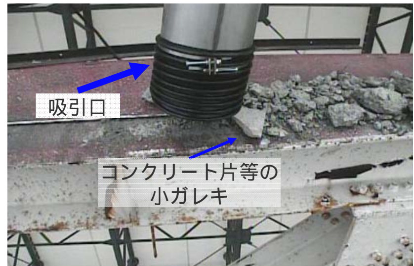
既存鉄骨梁上のコンクリート片等の小ガレキ吸引作業の様子