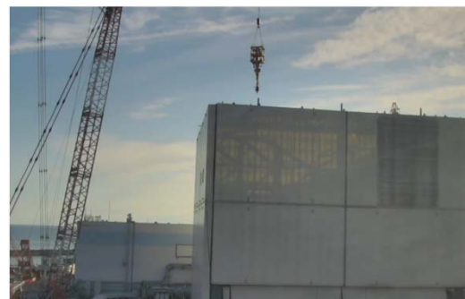
撤去装置吊り込み状況