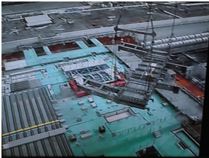
西側ストッパ 吊り上げ中