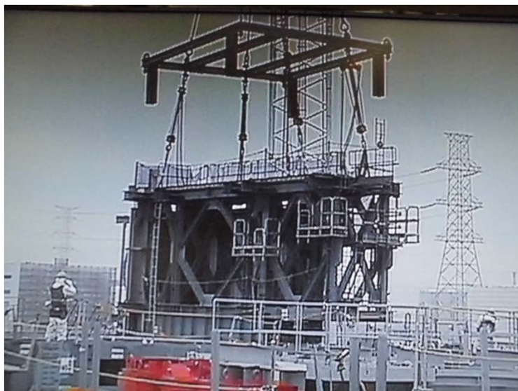
FHMガーダ鉄骨部材 吊り上げ中