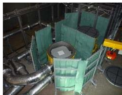
交換型フィルタユニット