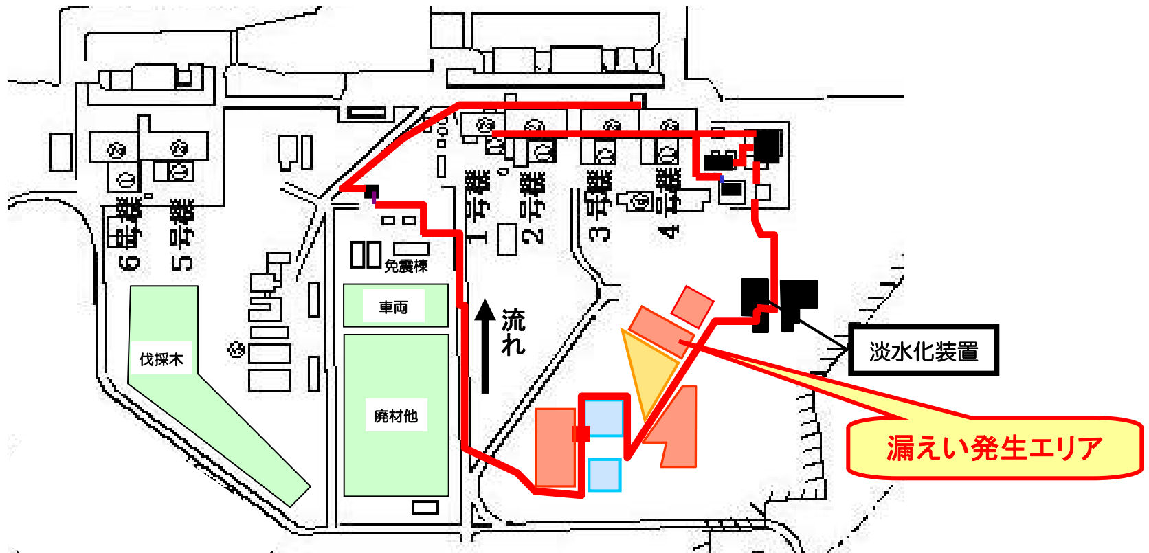
1～4号機 水処理設備配置図