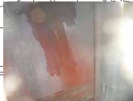
の方向から見たトールス(北西側)