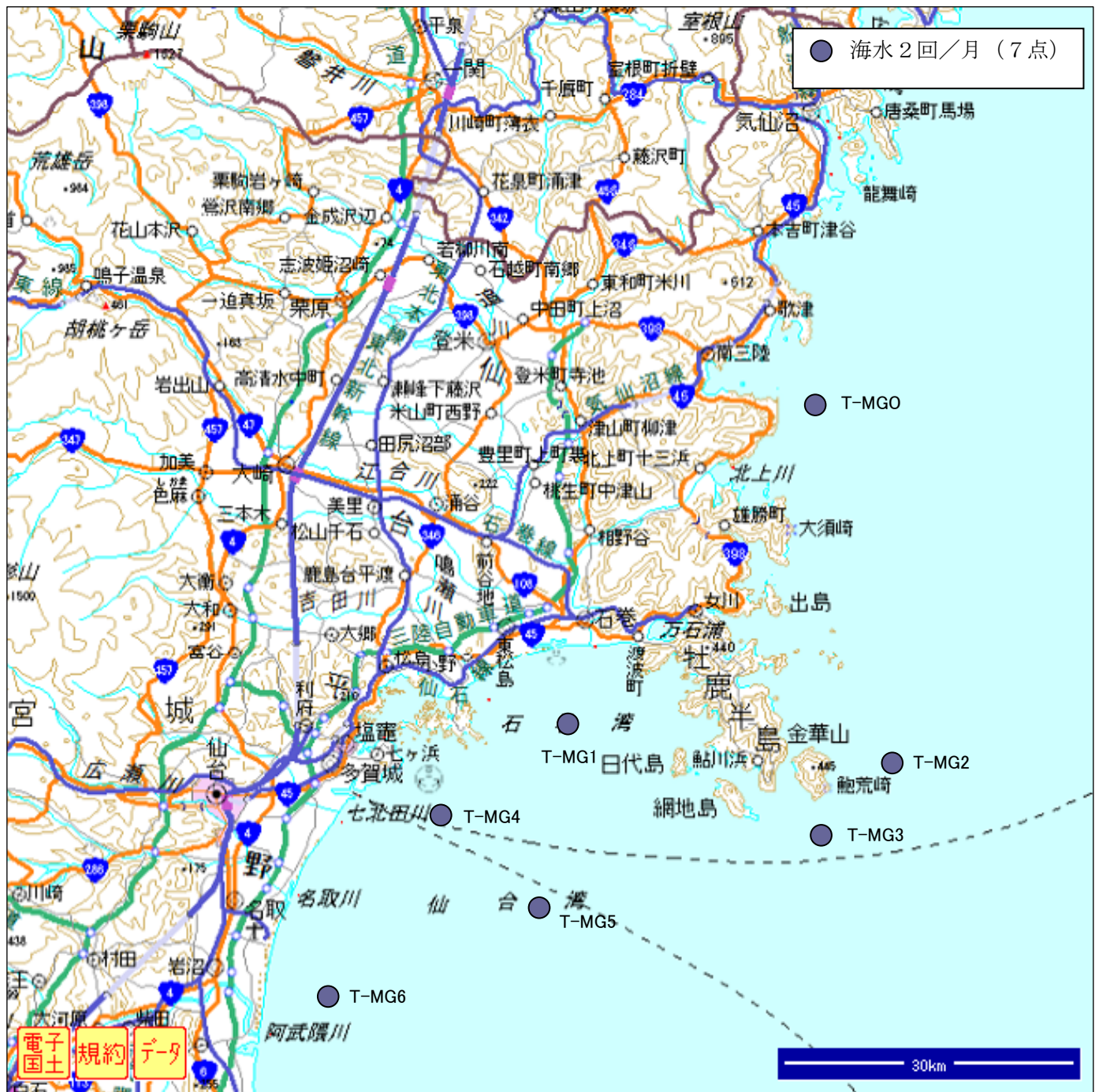
図3. 海水等サンプリング位置（宮城沿岸、H24年5月現在）