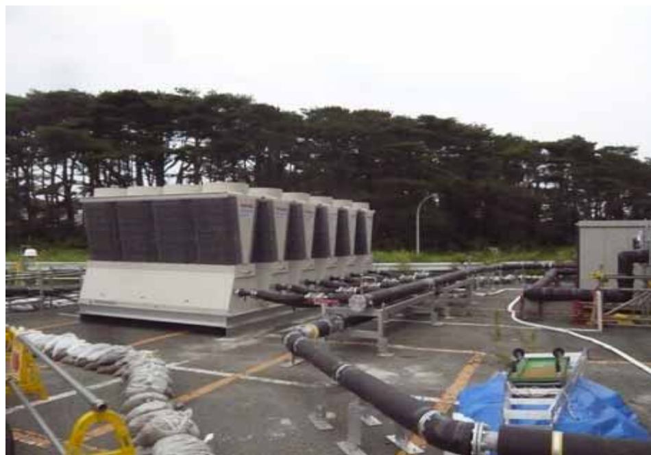
冷凍機 配管接続状況 撮影日：平成24年7月13日