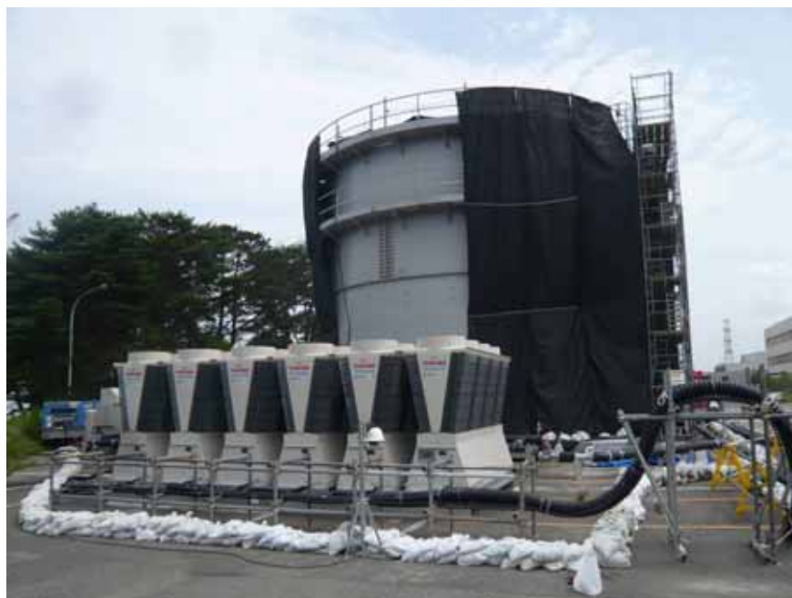
処理水バッファタンク（奥）、冷凍機（手前） 撮影日：平成24年7月13日