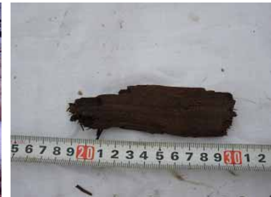
< 第4段インペラ部で確認された木片 >