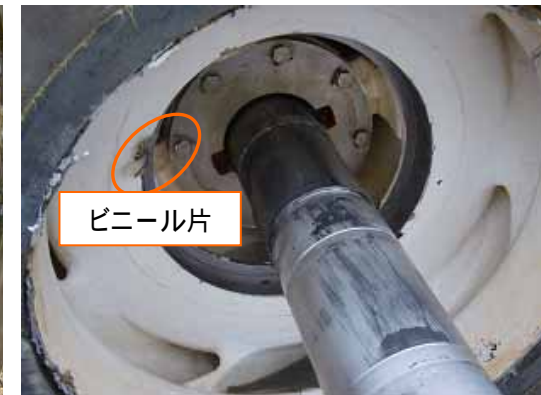
< 第4段ガイドケーシング内部 >