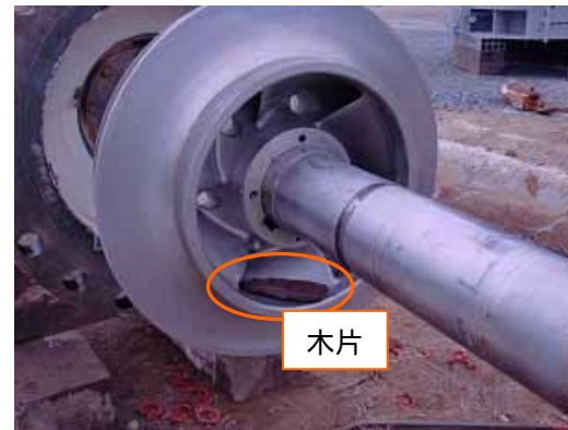
< 第4段インペラ部 >