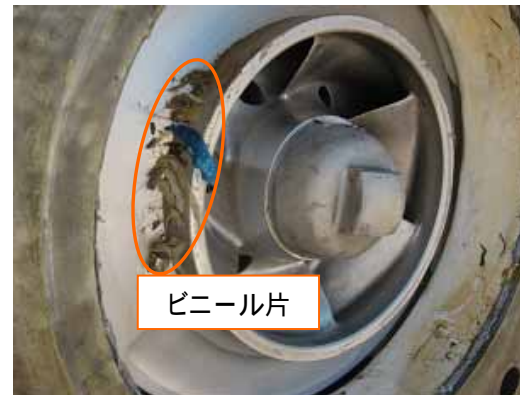
< 第1段インペラ部 >