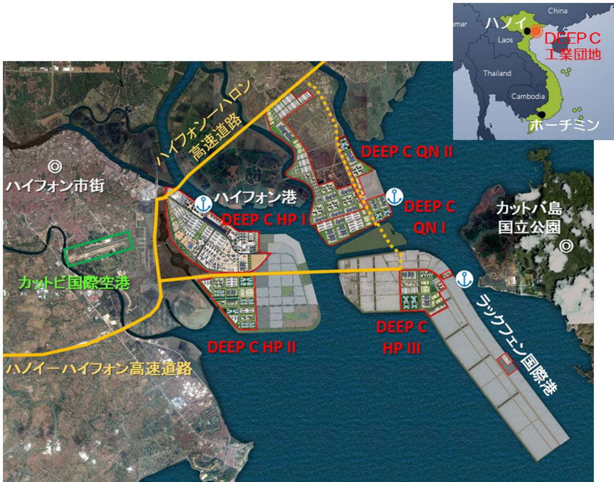
【DEEP C 工業団地の概要】