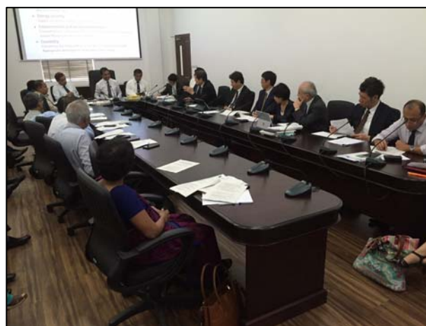
電力・再生エネルギー省との打ち合わせ