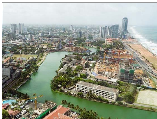
コロンボ市内の風景