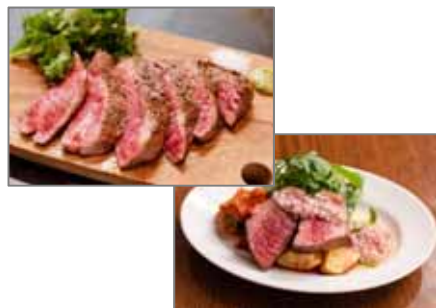
福島牛を使ったメニュー

拡 10月1日～11月末、首都圏の飲食店（38店舗）と連携し、福島牛を使ったメニュー提供とともにグルメサイト「Retty※」やインフルエンサーを活用したPRを展開する。