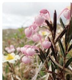
ヒメシャクナゲ(春)