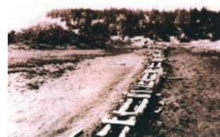
荒廃が最もひどかったアヤマメ平。

昭和30年代半ばに入り、人々の生活に余裕が出始めると、「尾瀬ブーム」と言われるほど多くのハイカーが尾瀬を訪れるようになりました。しかし当時はまだ、木道や公衆トイレなどの自然をまもるための設備が整っておらず、またマナーも確立していなかったため、人々は自由に湿原を歩き回り、踏み荒らしてしまいました。その頃から、東京電力では木道を整備し、自然を傷めることなく自然とふれあっていただくよう、皆さんにもご協力をお願いしてきました。二度と悲しい尾瀬の歴史を繰り返さないよう、木道、登山道を外れずに歩いて下さい。