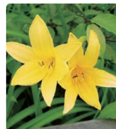
ニッコウキスゲ(夏)