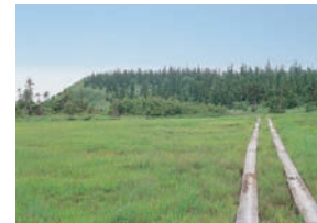
長年にわたり回復作業に取り組み、やっと緑が戻ってきています。