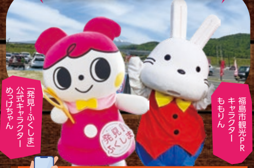
「発見!ふくしま」公式キャラクタ―めつけちゃん