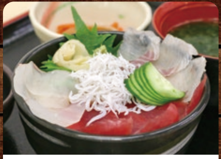
海鮮丼 寿司〇(まる) ふくしま常磐もの海鮮丼