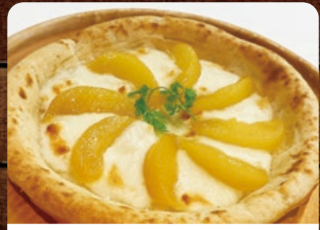
あづまキッチン 福島県産桃とモッツアレラチーズのピザ 〜はちみつがけ〜