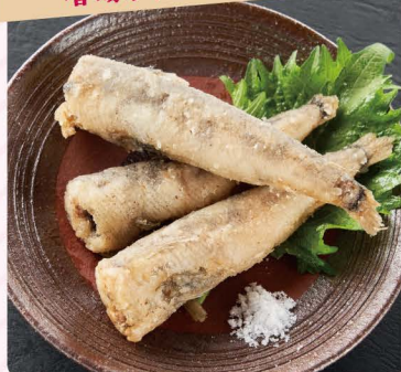
常盤ものメヒカリの 唐揚げ(3尾)