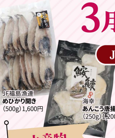
JF福島漁連 めひかり開き (500g) 1,600円

12:00 / 13:30 / 15:00 / 16:30 ※天候等により変更となる場合がございます。