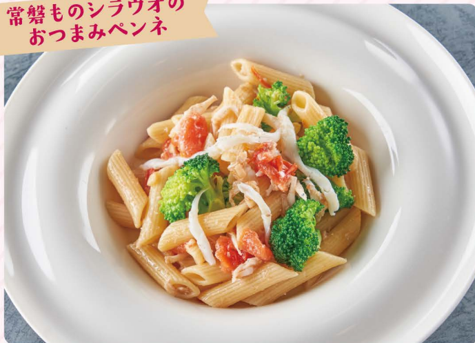
常盤ものシラウオの おつまみペンネ