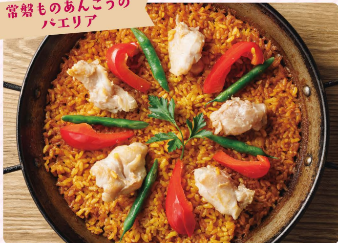
常盤ものあんこうの パエリア