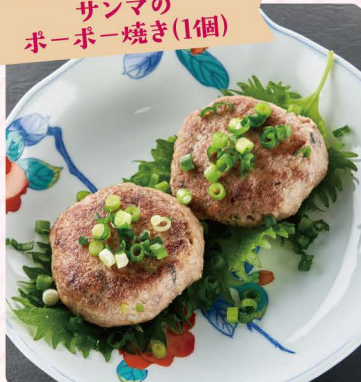
サンマの ポーポー焼き(1個)