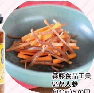
森藤食品工業 いか人参 (310g) 570円