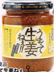
吾妻食品 うまて生姜ねえ (240g) 650円

福島県浜通りで獲れる水産物は「常盤もの」と呼ばれ、旨味が強く質の良い魚として有名!