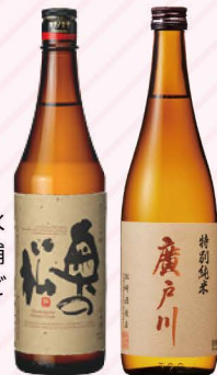
JAふくしま未来 桃の恵み (190g) 200円

松崎酒造 廣戸川 特別純米 (720ml) 1,250円 奥の松酒造 奥の松 あだたら吟醸 (720ml) 1,200円 飲み比べセット (60ml×3杯カップ売り) 700円