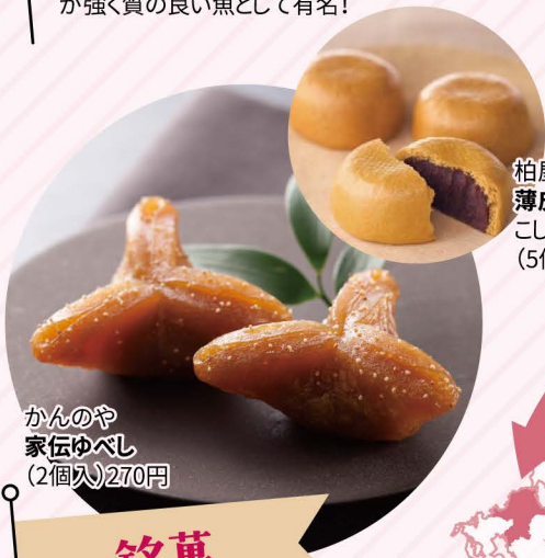
柏屋 薄皮饅頭 こしあん・つぶあん (5個入) 800円

福島県で食べ継がれてきた郷土の味!市民に愛されるソウルフード!ご飯が進む一品です。