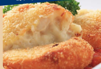
ホタテのクリーム コロッケ(2個)

キッチンカーで 500円(税込)以上 お買い上げの方に 除菌シートを プレゼント!!