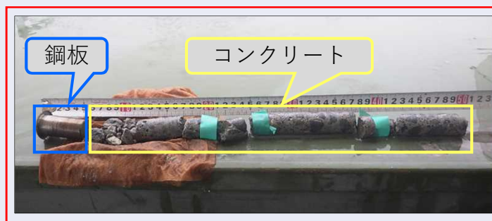
採取した鋼板並びにコンクリート

4号炉の格納容器試料採取で使用する工具を使い、格納容器と同等の材質（鋼板やコンクリート）で造られている模擬品から鋼板並びにコンクリートを採取できることを確認しました。