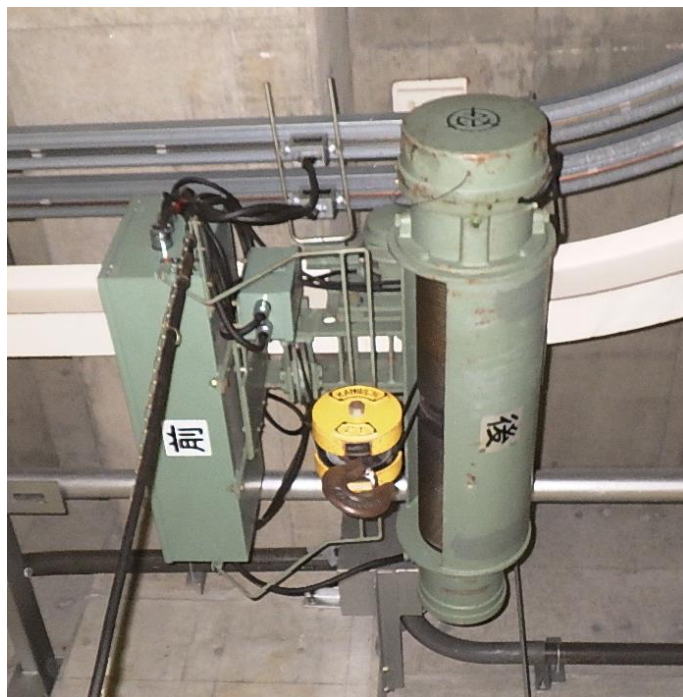
操作した小型クレーン