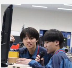
新入社員が司会進行