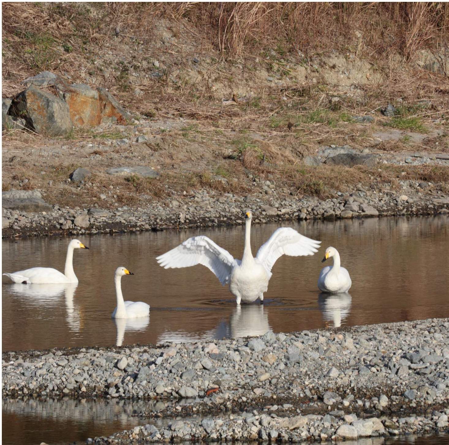
冬の来訪者 撮影時期:2025年12月 撮影場所:富岡川（富岡町）