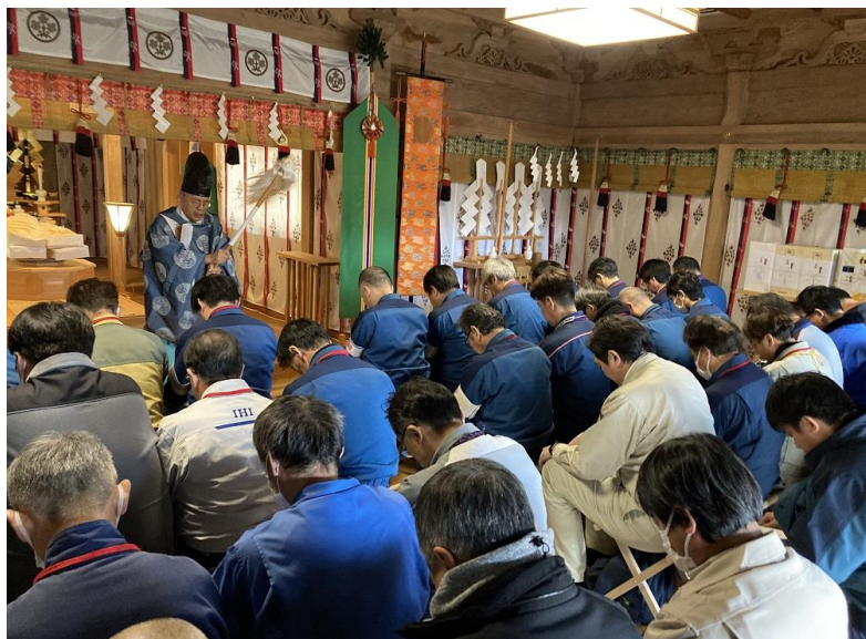
安全祈願祭の様子