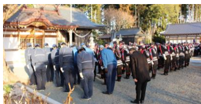
<写真下2枚> 無火災祈願、消防団パレードの様子