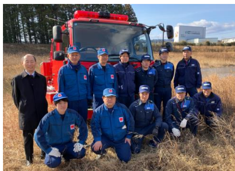
当発電所から参加した協力消防隊