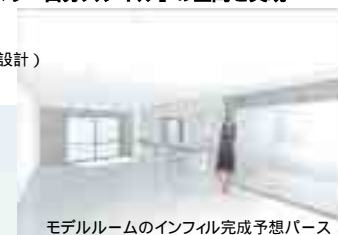
モデルルームのインフィル完成予想パース