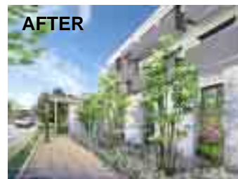
完成イメージ 変更になる可能性があります

外構) 周辺住民にも開かれたオープンスペースで雰囲気のあるエントランスを演出 (植栽のリニューアル) オートロック+ グリルシャッターで敷地内のセキュリティーを確保 駐車場平置き 100%