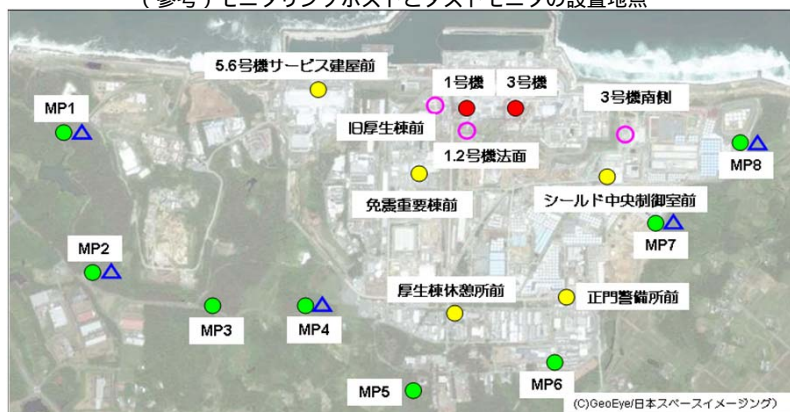
(参考) モニタリングポストとダストモニタの設置地点

モニタリングポストのリアルタイムデータにつきましては、当社ホームページ「福島第一原子力発電所構内でのモニタリングポスト計測状況」 http://www.tepco.co.jp/nu/fukushima-np/f1/index-j.html からご覧いただけます。