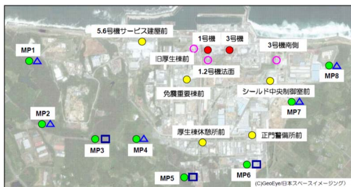
(参考) モニタリングポストとダストモニタの設置地点

モニタリングポストのリアルタイムデータにつきましては、当社ホームページ「福島第一原子力発電所構内でのモニタリングポスト計測状況」 http://www.tepco.co.jp/nu/fukushima-np/f1/index-j.html からご覧いただけます。