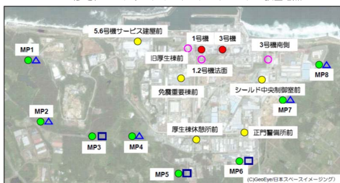
(参考) モニタリングポストとダストモニタの設置地点

※モニタリングポストのリアルタイムデータにつきましては、当社ホームページ「福島第一原子力発電所構内でのモニタリングポスト計測状況」 http://www.tepco.co.jp/nu/fukushima-np/f1/index-j.html からご覧いただけます。