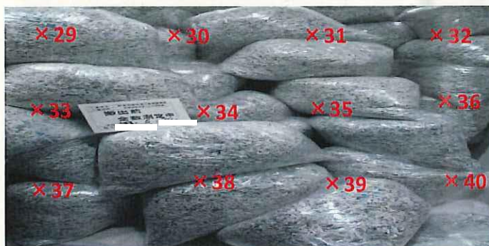
段ボール・シュレツダー屑 表面線量率測定結果 ( \mu\text{Sv/h} )

測定器: F1-SC-174 時定数: 10 sec BG: 0.10 \mu\text{Sv/h}