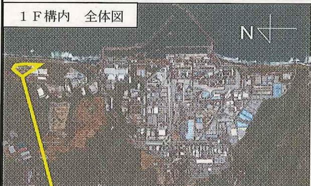
1 F 構内 全体図