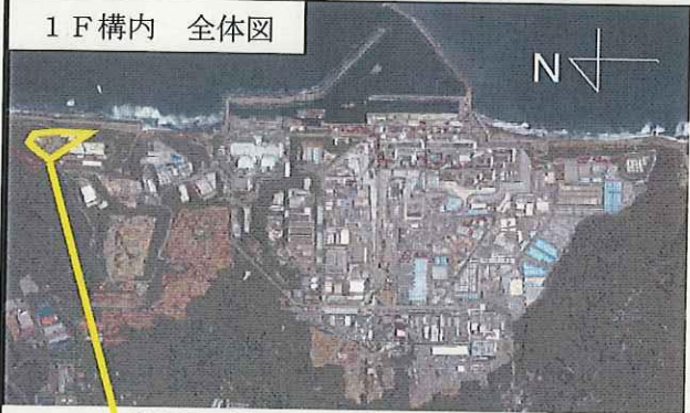
1 F 構内 全体図