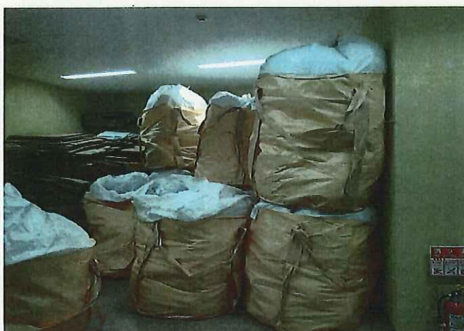
袋表面 線量率測定結果 ( \mu\text{Sv/h} )

測定者: 測定器: F1-SC-110、F1-SC-137 時定数: 10 sec BG : 0.10 \mu\text{Sv/h}