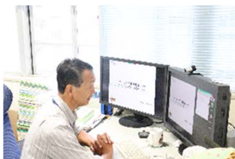
福島大学による発表の様子①