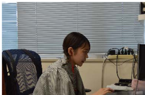
福島大学による発表の様子②