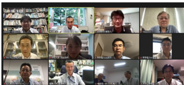
報告会に参加した参加者（オンライン）