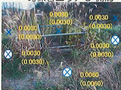
一時保管エリアC 側溝