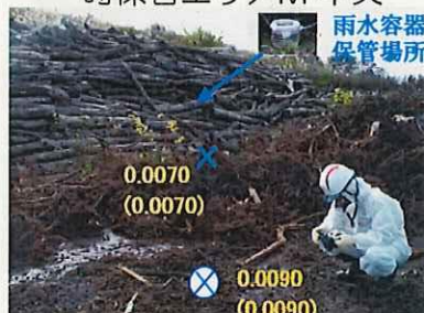
一時保管エリアM 中央