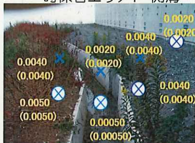
一時保管エリアP 側溝