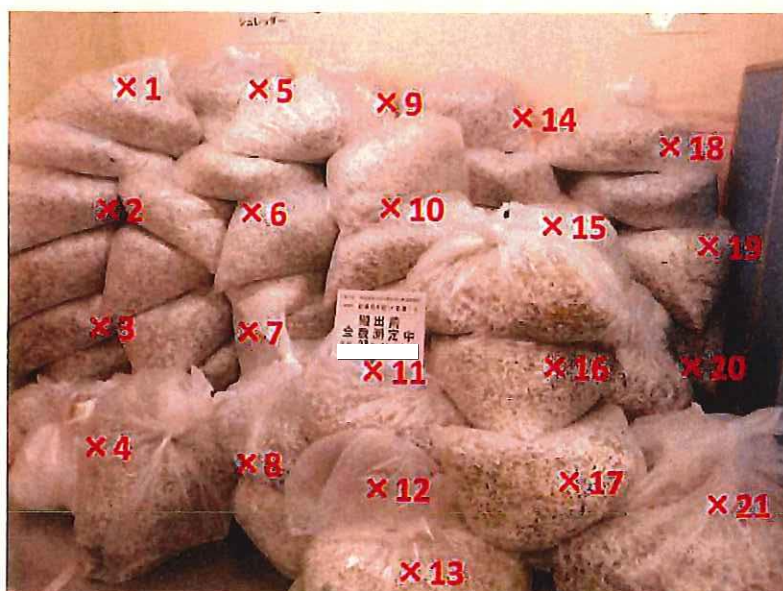
シュレッダー屑 表面線量率測定結果 ( \mu\text{Sv/h} )

測定器: F1-SC-209 時定数: 10 sec B G : 0.07 \mu\text{Sv/h}