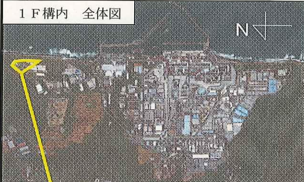
1 F 構内 全体図