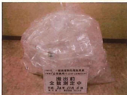
ペットボトル (袋入り)