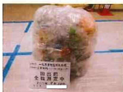
ペットボトル (袋入り)